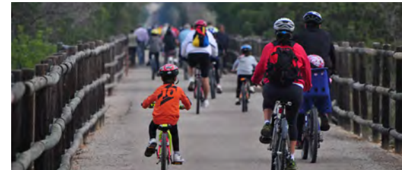
Via Verda de la Val de Zafán

Al quilòmetre 0 de la Via Verda, ubicat al municipi de Tortosa, i en sentit sud, neix el nou carril cicloturista Camí Natural de Tortosa, l'Aldea, Deltobre, que travessa entre els camps d'arrossars fins a arribar a la desembocadura del riu Ebre, unint, d'aquesta manera, el Parc Natural del Delta de l'Ebre i el Parc Natural dels Ports.