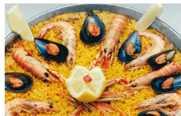
Gastronomia típica i variada

L'oferta d'allotjament és variada i inclou diverses modalitats: hotels, cases rurals, apartaments, càmpings, refugis, albergs i cases de pagès. Els establiments hotelers estan classificats per categories (estrelles), d'una a cinc; les pensions i hostals, d'una o dues.