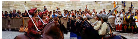
Festa del Renaixement (Tortosa)

D'altra banda, i com a conseqüència de la rellevància que ha adquirit en aquests darrers anys, també cal destacar el turisme rural , el qual ofereix als visitants un contacte directe amb la natura i els paisatges més bells de la comarca del Baix Ebre.