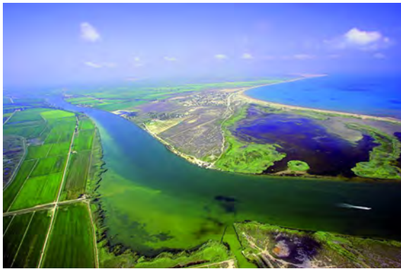
Parc Natural del Delta de l'Ebre

La Confederació de Comerç de Catalunya, entitat que representa la majoria dels empresaris del comerç català i les seves associacions, amb aquesta guia, vol donar-vos informació sobre Catalunya i la seva llengua pròpia: el català. Al mateix temps, però, també té la intenció d'informar-vos sobre el comerç i el turisme dels seus pobles i ciutats. En aquesta edició, i amb la col·laboració del Consell Comarcal del Baix Ebre, aquest fullet us facilita un seguit de dades pràctiques que us poden ser útils a l'hora de planejar la vostra estada en aquesta comarca i gaudir del turisme i del comerç de la manera més adequada.