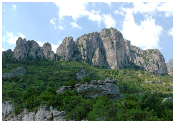
Parc Natural dels Ports

Un paisatge que defineix una comarca especial i diferent, i que fa de la seva història i de les seves característiques singulars un punt de trobada únic i meravellós. Per aquest motiu, esperem que el contingut d'aquesta guia us sigui útil i us faciliti una bona estada al Baix Ebre.