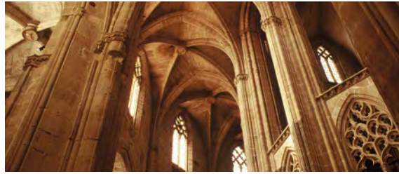
Catedral de Tortosa

El Baix Ebre és una comarca única i singular que disposa de totes les eines per esdevenir un territori obert al turisme i amb un enfocament clar i unívoc cap al turisme familiar .